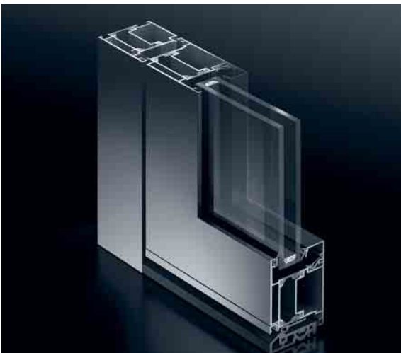
Schüco Tür ADS 60 Schüco Door ADS 60