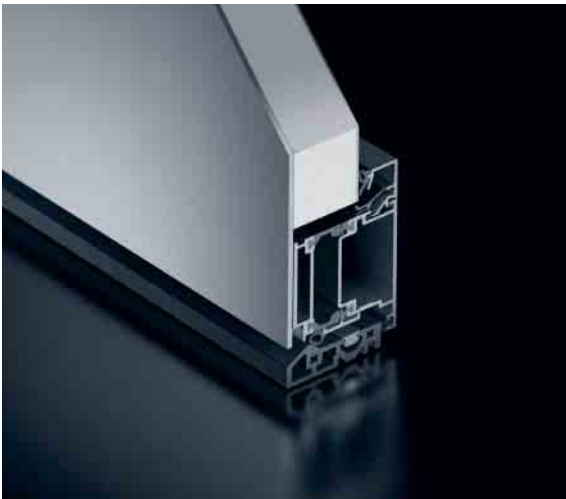
Schüco Tür ADS 60 mit flügelüberdeckender Füllung Schüco Door ADS 60 with leaf-enclosing infill panel