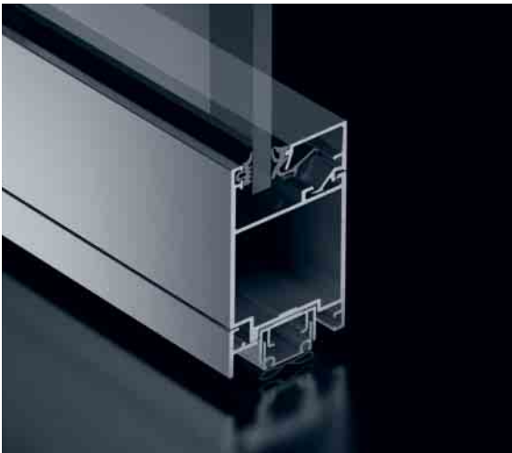
Schüco Tür ADS 50.NI Schüco Door ADS 50.NI