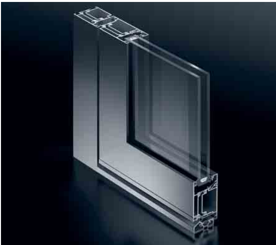
Schüco Tür ADS 50 Schüco Door ADS 50

Das Türsystem für wirtschaftliche Eingangslösungen in gedämmter und ungedämmter Ausführung (NI).